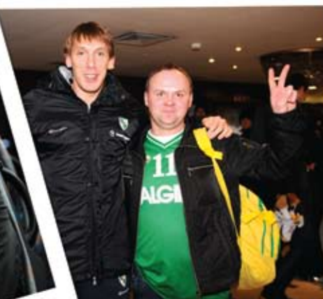
AŠ SU DAINIUMI ŠALENGA